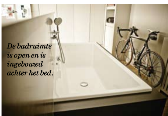
De badruimte is open en is ingebouwd achter het bed.