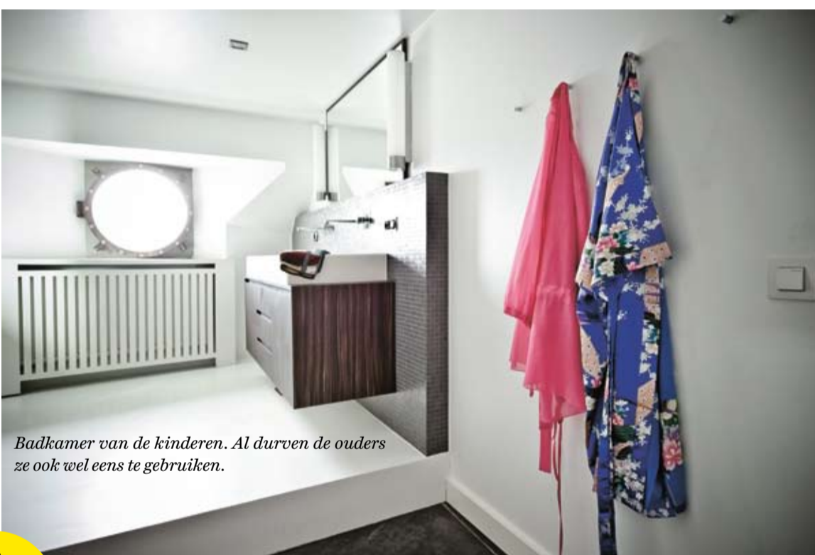
Badkamer van de kinderen. Al durven de ouders ze ook wel eens te gebruiken.