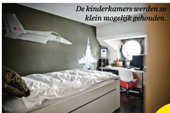
De kinderkamers werden zo klein mogelijk gehouden.